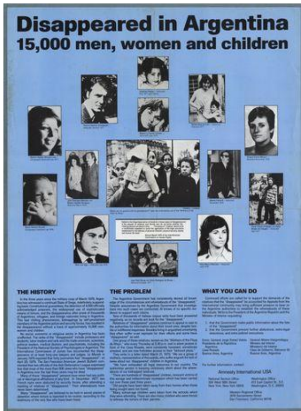
Imagen 5. Cartel. Fuente: IISH-Amnesty International, ca. 1980.

En términos gráficos, el afiche tenía un diseño simple, al punto de que el sentido fue anclado en un largo texto con letras chicas y con copiosa información sobre los desaparecidos. Tenía en el centro a los pañuelos de las Madres y Abuelas, se destacaban los niños, las mujeres y las estampas familiares. Usaba el color celeste, que estaba asociado con la Argentina como se sabía internacionalmente por la camiseta en el mundial de fútbol. La organización de las fotografías recordaba las pancartas levantadas por las madres en las marchas, esas imágenes que lograron revertir la clandestinidad de un crimen que operaba anulando cualquier tipo de conocimiento. La composición tenía relación directa con las imágenes que movilizaba la prensa internacional al referir a las violaciones de derechos humanos en Argentina. 22