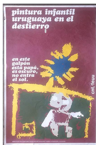
Imágenes 2 y 3. Afiches de la campaña por los presos políticos uruguayos, ca. 1978. Los dos diseños apelan al dibujo de los niños para reforzar la estrategia visual y retórica del texto. Los afiches circularon en posteos de Facebook, ca. 2020.

En este contexto, en 1979, un informe de Amnesty les otorga la voz en primera persona a los niños en un nuevo informe dedicado exclusivamente a su situación, que avanzaba en la comprensión de la violencia ejercida sobre los niños y bebés. Comenzaba con el relato de un chico de 13 años que tenía dos hermanos de seis y cuatro años: