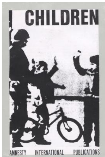
Imagen 6. Portada del informe "Children" de Amnesty Internacional (1979).

Sin embargo, la iniciativa se politizó rápidamente. El hecho mismo de que la propuesta de un código vinculante surgiera de Polonia ponía en juego la oposición entre el mundo capitalista y el socialista, a pesar de que el proyecto reproducía en gran parte los principios del pliego de 1959. De allí que, rápidamente, diferentes países expresaran su interés en trabajar en una propuesta alternativa, que fue encargada a la Comisión de Derechos Humanos de Naciones Unidas. Amnesty International decidió aprovechar la agenda para denunciar la violación de los derechos humanos de los niños. Lo consideró una oportunidad para actuar políticamente sobre el contexto de ese año y, eventualmente, sobre la agenda de cuestiones a incorporar en el posible borrador sobre los derechos de los niños. Decidió elaborar un informe para visibilizar la violencia sufrida por chicas, chicos, niños y bebés. No quedaron los memos de la reunión en la que se tomó tal decisión en la copiosa documentación consultada. Sin embargo, el informe explica que la idea reproducía la estrategia de la institución en el Año Internacional de la Mujer, cuando, también, presentó una denuncia.