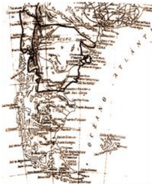
Zona de reinado de Orlie I 24