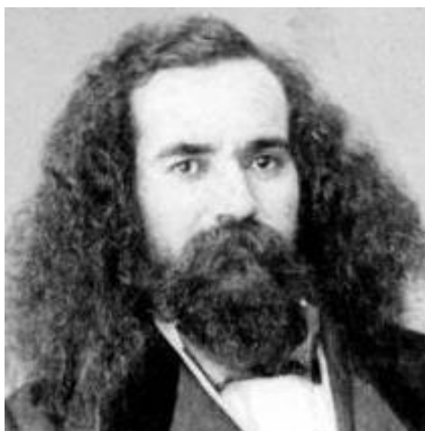
Orlie Antoine de Tounens

Por otra parte, es menester resaltar que su presencia y los eventos que transcurrieron en el desierto patagónico pasaron prácticamente inadvertidos a los gobiernos del Estado de Buenos Aires y a las sucesivas presidencias de Mitre, Sarmiento y Avellaneda, algo que no ocurrió por parte del gobierno chileno en tiempos en que se conquistaba la Araucanía, siendo que ambos Estados se hallaban en la etapa de consolidación del Estado nacional.