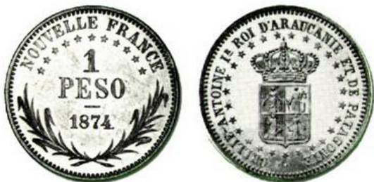
Moneda de pretensión: 1 Peso, Reino de Araucanía y Patagonia (1874) 64

sus esperanzas se vieron frustradas por la intervención del zar. Por su parte, la Francia republicana de Thiers había cerrado la puerta a sus aspiraciones, ya que al ser recibido por un representante de su gobierno, se le había negado todo apoyo debido a la incompatibilidad entre los principios republicanos y los monárquicos.